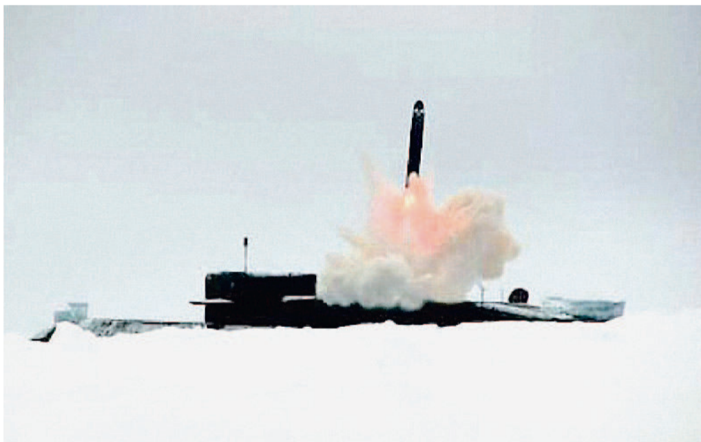
Пуск ракеты «Синева».