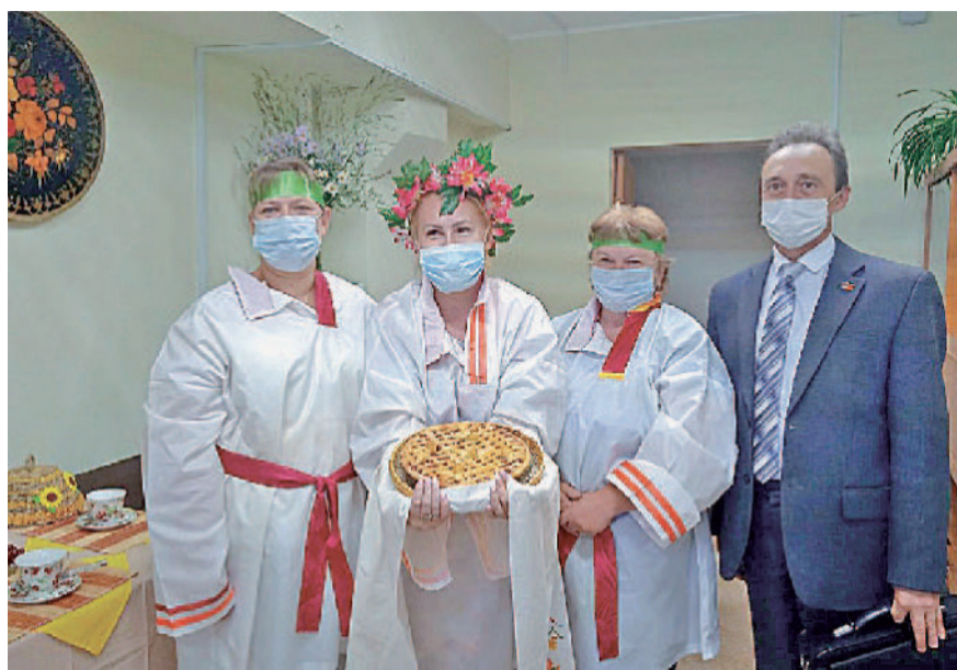
Встречали хлебом-солью (цех № 19).

Во второй группе участников определились свои победители. Уютную кухню в стиле «хай-тек» представил отдел № 288. В интерьере четко выра-