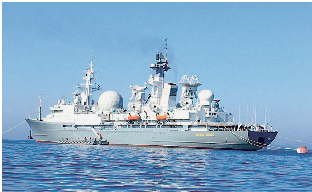
Исследовательское судно «Маршал Крылов».

Главным конструктором и вдохновителем создания БРПЛ являлся легендарный академик Виктор Петрович Макеев. Именно он изобрел «ракетный конвейер». Смысл его заключался в следующем: пока одно серийное изделие выпускается, завершается опытно-конструкторская разработка второго и начинается