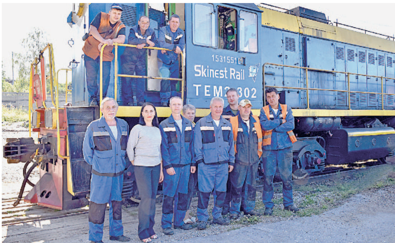
Коллектив железнодорожного участка.